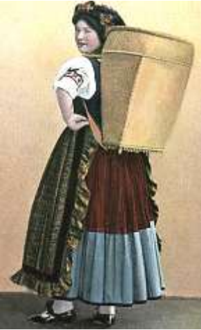
alte Ansichtskarte Frau in thüringischer Tracht mit Kiepe

Kennst du vielleicht auch diese Frau? Willst du deine Sündenlast noch weiter tragen auf deinem Rücken und unfroh sein? Dann hast du noch nicht richtig die Bibel gelesen. Da steht es glasklar: