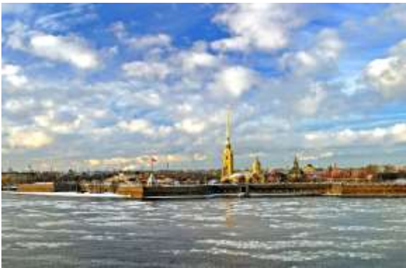
St.Petersburg am Fluss Newa, Russland

So ist es auch mit der Offenbarung. Sie zeigt uns in vielen Bildern die Entwicklung der Geschichte von der Menschheit, von Israel sowie von der Gemeinde. Ab Kapitel 21 zeigt sie epochale gewaltige Zeiten = Ewigkeiten, auch nur für uns in verständlichen Bildern. So ist der Bericht vom Lebensstrom für uns nur kurz gefasst in zwei Versen. Der Zeitraum umfasst aber Ewigkeiten, die für uns unvorstellbar sind.