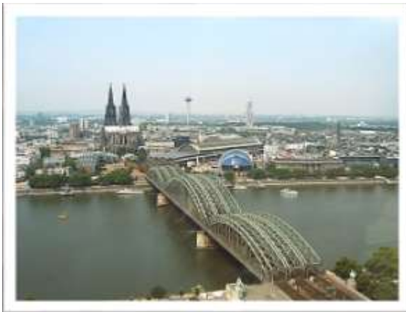
Hohenzollernbrücke in Köln am Rhein

Der größte Strom, den ich kenne, ist der Rhein. Über die Hohenzollernbrücke in Köln braucht man 15 bis 20 Minuten, um hinüberzugehen. Das ist die normale Zeit für einen Kilometer. Aber der Rhein ist da sehr tief, und man kann in ihm ertrinken. Aber bei dem Gnadenstrom ist man nach tausend Ellen (500 m) erst bis an den Knöcheln drin, während man im Rhein nach dieser Weite von 500 Metern äußerst tief auf dem Flussbett und mit Wasser überhäuft sein würde. Der stärkste Atemtaucher hielte das nicht lange durch.